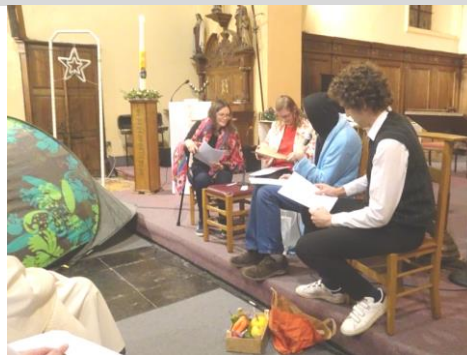
Et à Petit-Roieux...