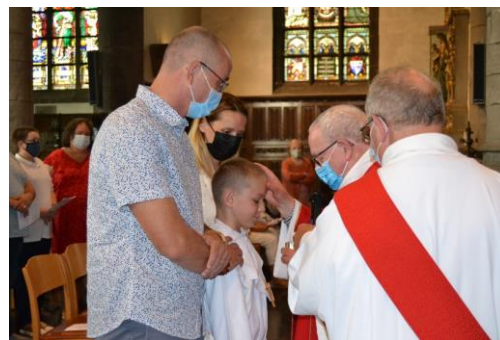
12 septembre à 9h30 à l'église St Géry de Marche-lez-Ecaussinnes