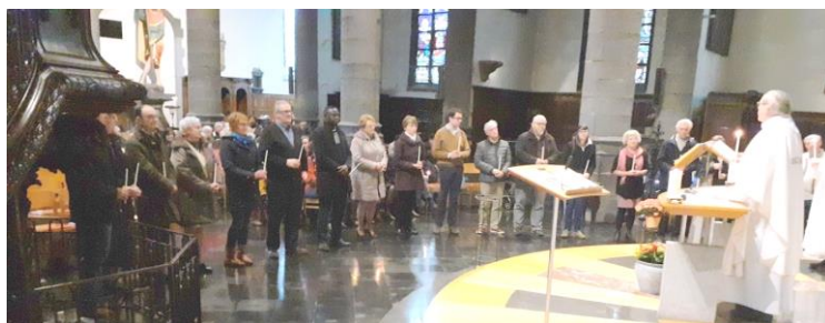
La photo reprend une grande partie des membres

Le Conseil Pastoral 2020-2023 : assemblée des représentants de nos clochers et des délégués de certains secteurs-clé de la vie paroissiale avec l'équipe des prêtres et diacres