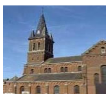
Eglise du Sacré-Cœur

Chaque mercredi du mois de mai, sauf le 1 er mai, récitation du chapelet, à 15h, dans la chapelle de l'église du Sacré-Cœur.